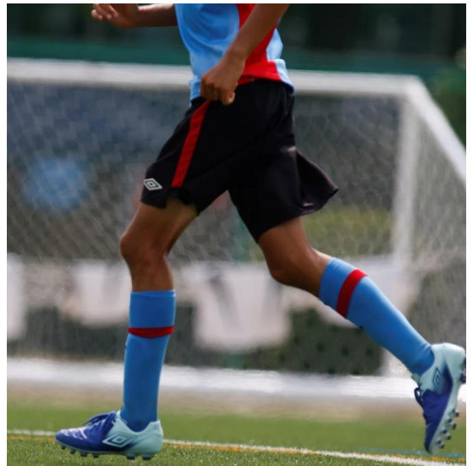
「GAINA」搭載アイテムを着用している様子