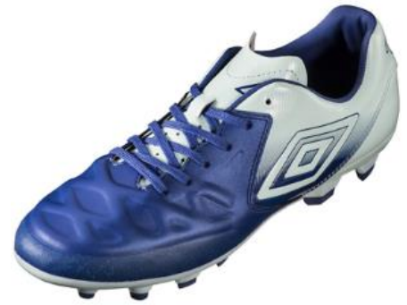
「ACR シーティアー KTS HG」

品 名：「ACR シーティアー KTS JR HG」 (ジュニア) 品 番：UU4NJA01 価 格：¥8,500+税 サイズ：21.5-24.0 (0.5 cm刻み)